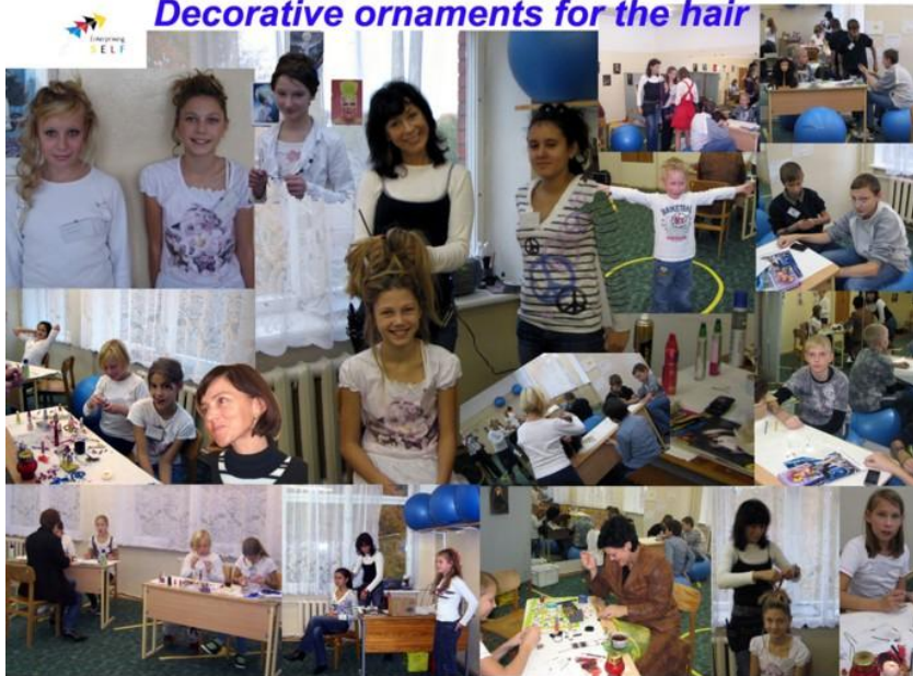
Мастерская по изготовлению украшений для причесок