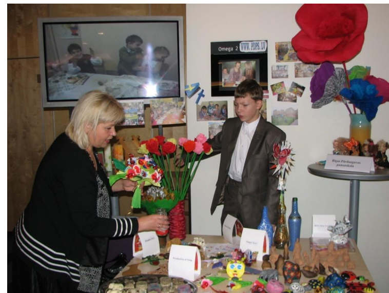
Выступление-презентация проекта в отеле «Латвия»

Выбор учеников может быть ограничен только за счет отсутствия вакансий (фактор оперативности в принятии решений). В случае нетрудоустроенности, накануне открытия фирм, у ученика есть возможность обратиться на биржу труда, руководителями которой являются члены Совета (не принимают участия в работе мастерских, в дальнейшей работе их функции меняются на рекламных менеджеров, бухгалтеров, налоговых инспекторов).